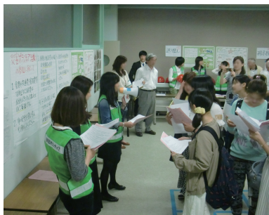
マッチングコーディネーター養成研修

アルもほぼできあがっています。現在は、災害ボランティア活動の意義、せたがや災害ボランティアセンターの活動、世田谷が被災した場合のマッチングシステム、コーディネーターの活動マニュアルなどをまとめた小冊子を制作しています。この小冊子がまもなく完成しますので、町会等の地域組織への説明や呼びかけに活用したいと思います。そうやって、理解を深めていただいてはじめて、地域の共助の活動が浮かび上がって