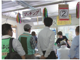
災害ボランティアセンター受付の様子 (2011年岩手県陸前高田市)

3月11日の東日本大震災から5年目が経過する。被災地ではまだ復興の兆しが見えないうえ、被災者の生活の再建は依然として大きな課題となっている。また、震災から5年が経ち、被災者の心のケアや生活の再建に向けた支援活動が引き続き必要とされている。こうした状況の中、被災者の生活再建に向けた支援活動が引き続き必要とされている。また、震災から5年が経ち、被災者の心のケアや生活の再建に向けた支援活動が引き続き必要とされている。