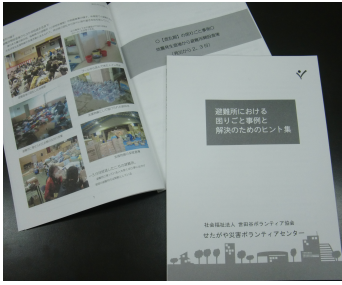
『避難所における困りごと事例と解決のためのヒント集』

それ以降、災害ボラセン運営委員会の中に、更に具体的な課題を検討するワーキングチームを組織し、世田谷で災害が起きた場合に、区の地域防災計画と連動して即座にボランティア活動を開始するための体制をつくる取り組みが行われています。