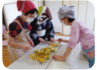
元気をわけあう地域デイサービス