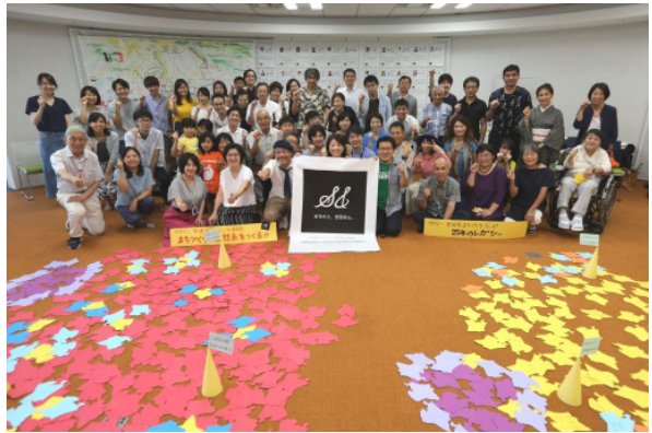
財団設立キックオフイベントには約 100 名が集まった。

シンボルマークには Sympathy (共感), Support (支援), Sustainability (持続可能性), Setagaya (世田谷) の S と、ともに (&) 取り組もうという想いが込められている。