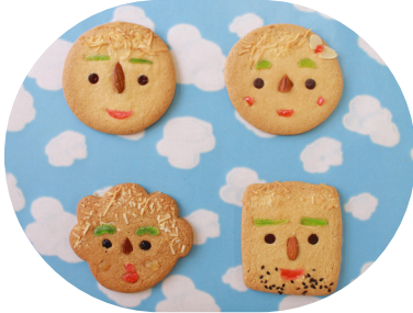
キュートな「しもまるくんファミリーサブレ」 (1枚 100円)。左上がしもまるくん。