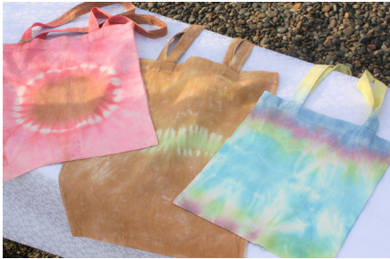
手染めエコバッグ (400 ~ 600 円) ■奥沢福祉園 (電話 5758-3546)