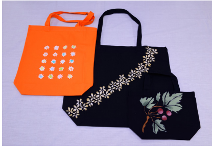
ステンシルバッグ・布地 (800 ~ 1,100 円) ■用賀福祉作業所 (電話 3708-5061)