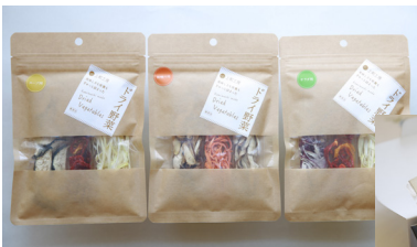
切干大根・ドライ野菜 (200 円～) 季節のドライフルーツ (350 円～)