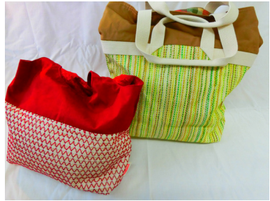
かばん (1,000 円～) ■千歳台福祉園 (電話 3789-9801)

7月からレジ袋が有料化になり、いままで以上にエコバッグを持つ方が増えています。バッグにひとつ入れておくと便利。こんな素敵なエコバッグはいかがですか？