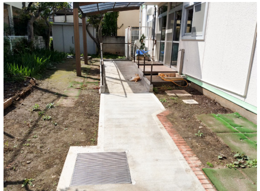
1階庭側 スロープがあり車いすでも入室できます