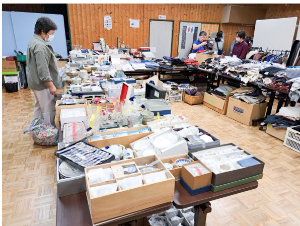
北沢ボランティアビューロー秋バザーの準備中