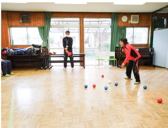
ご近所カフェでボッチャ体験している様子