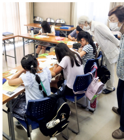
北沢ボランティアビューローのナツボラ・ジュニアでのコマ