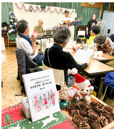
ご近所カフェのクリスマス会で、皆さんと歌をうたっている様子