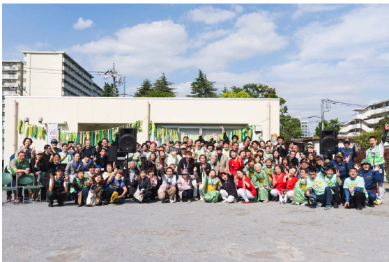
参加団体の皆さんで記念の集合写真