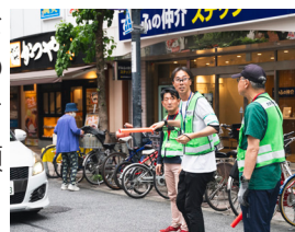
ボランティアの方と 交通誘導

4月から常勤職員として仕事をしています。ボランティアは長年やっており、スポーツ系、子ども関連、動物関連などさまざまな活動をしてきました。仕事を通じて、多くの方との出会いを楽しみにしています。よろしくお願いいたします。