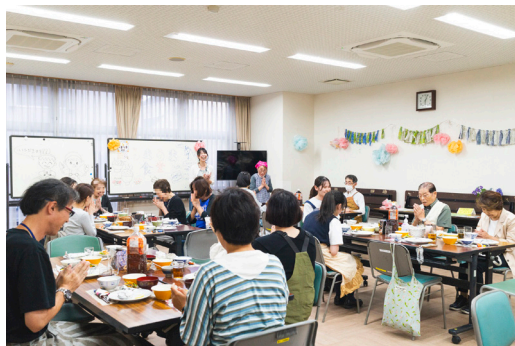
みんなで「いただきます！」

「一人で食べるご飯よりもみんなと一緒に食べるご飯はおいしいね」そんな言葉が飛び交う食堂を世田谷ボランティアセンターではじめました。ご飯はボランティアの方々で作っています。人とつながれる食堂を大切にこれからも続けていきます。(6月10日)