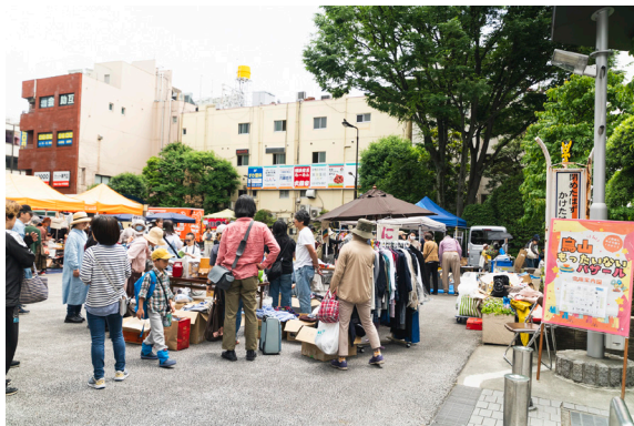
会場は大賑わいでした！